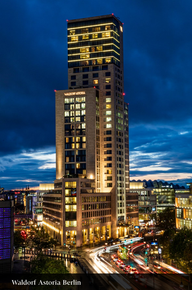
Waldorf Astoria Berlin