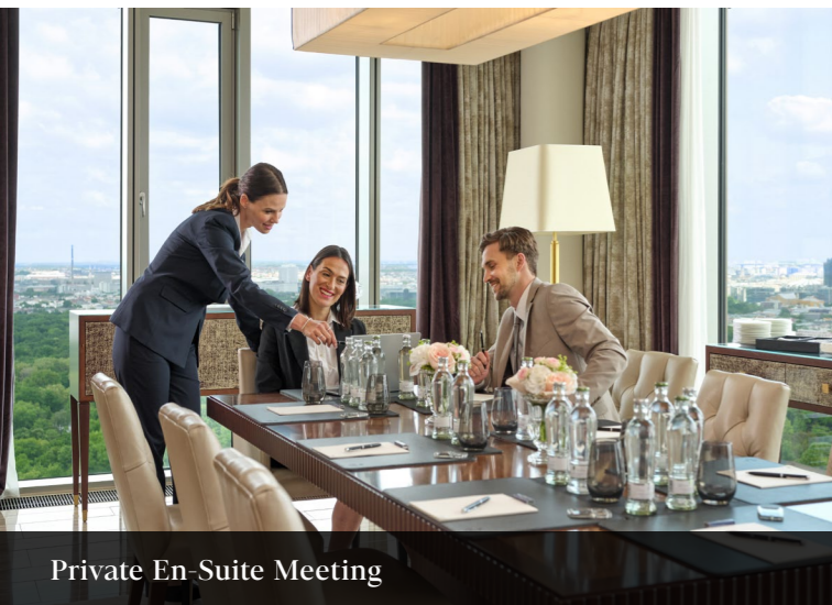
Private En-Suite Meeting