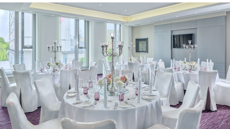
Park Avenue Salon