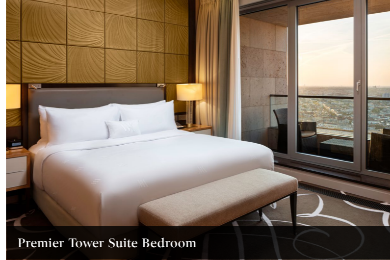
Premier Tower Suite Bedroom