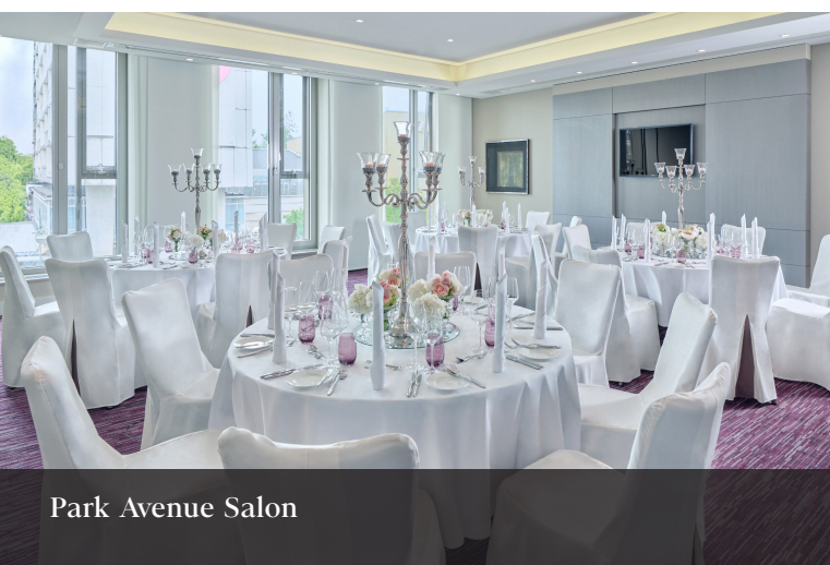
Park Avenue Salon