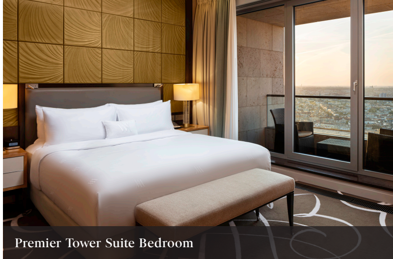
Premier Tower Suite Bedroom