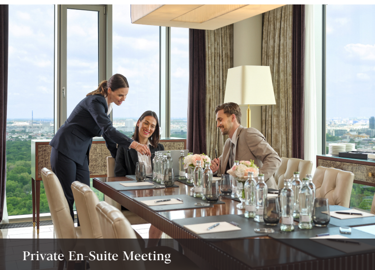
Private En-Suite Meeting